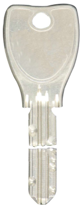
折れてしまった鍵